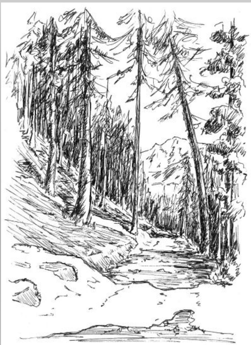
Résumé d'un des contes de la gobine, écrits par Pierre Lelong en 1929, recueil d'histoires que l'on racontait à la veillée le soir de la mise en tonneau du vin nouveau.

Frère Alphonse n'existe plus aujourd'hui, mais afin de rire entre eux, les gardes-forestiers l'ont surnommé le cornu d'Epainville.