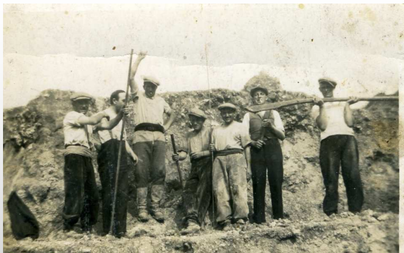
UN SOURIRE (POÈME DE RAOUL FOLLEREAU)

Un sourire ne coûte rien et produit beaucoup, Il enrichit celui qui le reçoit sans appauvrir celui qui le donne, Il ne dure qu'un instant, mais son souvenir est parfois éternel, Personne n'est assez riche pour s'en passer, Personne n'est assez pauvre pour ne pas le mériter, Il crée le bonheur au foyer, soutient les affaires, Il est le signe sensible de l'amitié, Un sourire donne du repos à l'être fatigué, Donne du courage au plus découragé Il ne peut ni s'acheter, ni se prêter, ni se voler, Car c'est une chose qui n'a de valeur qu'à partir du moment où il se donne. Et si toutefois, vous rencontrez quelqu'un qui ne sait plus sourire, soyez généreux donnez-lui le vôtre, Car nul n'a autant besoin d'un sourire que celui qui ne peut en donner aux autres.